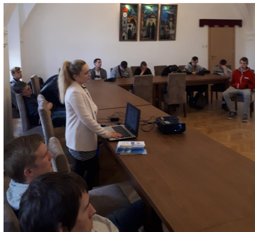
Spotkanie informacyjne w CKiW OHP w Oleśnicy