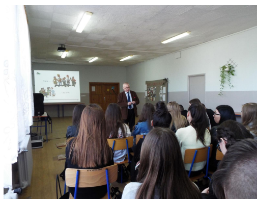
Spotkanie informacyjne w LO w Sycowie