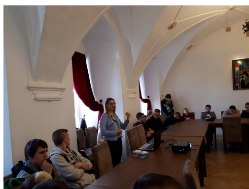
Spotkanie informacyjne w CKiW OHP w Oleśnicy

W dniach 10, 13, 16 kwietnia 2018 roku pracownicy Urzędu Pracy w Oleśnicy spotkali się z uczniami Centrum Kształcenia i Wychowania OHP w Oleśnicy (III klasa), Zespołu Szkół Ponadgimnazjalnych im. Orła Białego w Międzyborzu (klasa IV Technikum - Technik Żywności i Usług Gastronomicznych, klasa III Zasadniczej Szkoły Zawodowej - klasa wielozawodowa), w Liceum Ogólnokształcącym im. Tadeusza Kościuszki w Sycowie (3 klasy maturalne) oraz w Zespole Szkół Ponadgimnazjalnych w Sycowie . Młodzieży przedstawiono informację na temat sytuacji na lokalnym rynku pracy, a także na temat form wsparcia adresowanych do osób do 30 roku życia. Młodzież pozyskała także informacje na temat bezpiecznych wyjazdów do pracy za granicę.