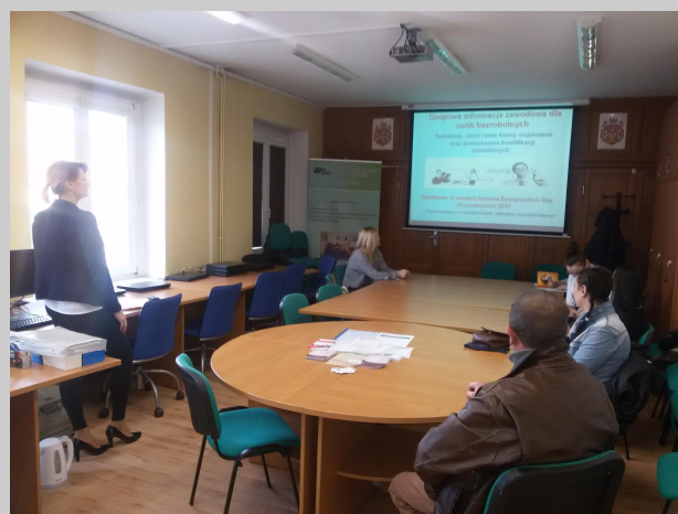
Spotkanie informacyjne z bezrobotnymi w Oleśnicy