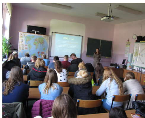
Spotkanie z uczniami ZSP w Sycowie