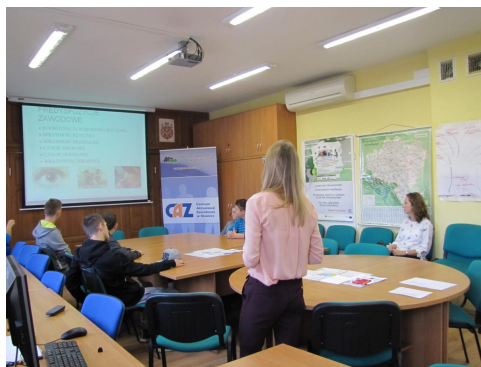
Spotkanie z uczniami SOSW w Oleśnicy

Natomiast w ramach Ogólnopolskiego Tygodnia Kariery w dniach 17.10.2017r. i 18.10.2017r. pracownice Powiatowego Urzędu Pracy w Oleśnicy Filii w Sycowie, odbyły spotkania z uczniami ostatnich klas Zespołu Szkół Ponadgimnazjalnych w Sycowie oraz Zespołu Szkół Ponadgimnazjalnych w Międzyborzu . W trakcie spotkań przekazane zostały informacje na temat: „Podstawowe usługi rynku pracy: dodatkowe instrumenty adresowane do bezrobotnych do 30 roku życia”.