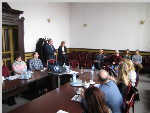
Spotkanie informacyjne z pracodawcami w Twardogórze