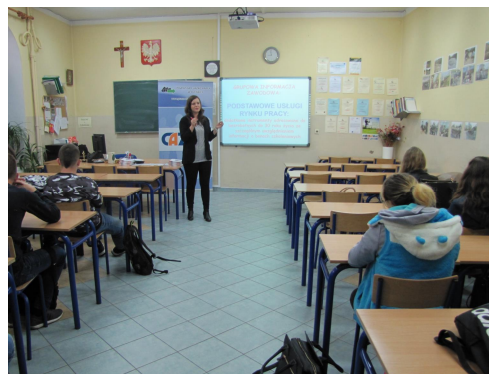
Spotkanie z uczniami ZSP w Bierutowie