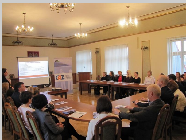
Spotkanie informacyjne z pracodawcami w Sycowie