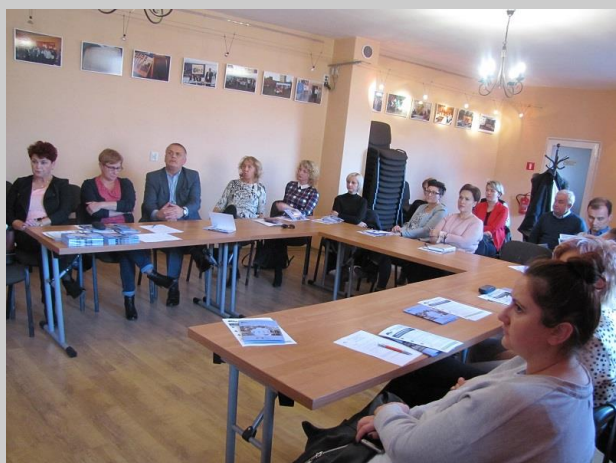
Spotkanie informacyjne z pracodawcami w Bierutowie