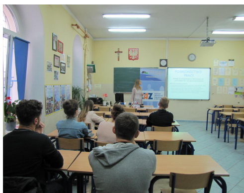
Spotkanie z uczniami ZSP w Bierutowie