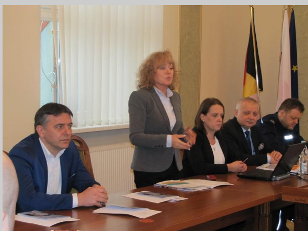
Spotkanie informacyjne z pracodawcami w Sycowie