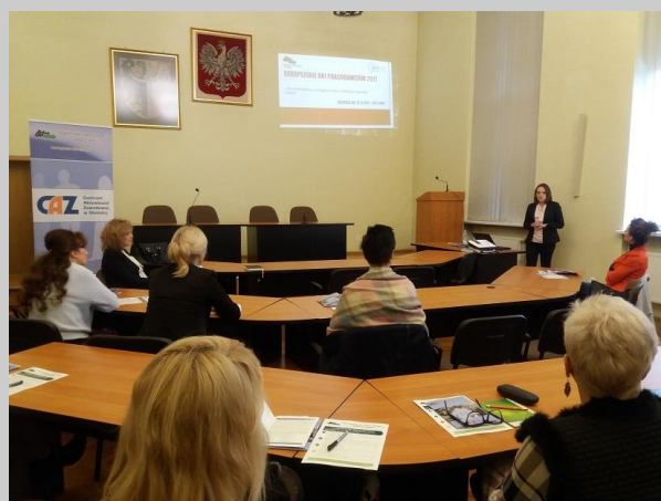
Spotkanie informacyjne z pracodawcami w Oleśnicy