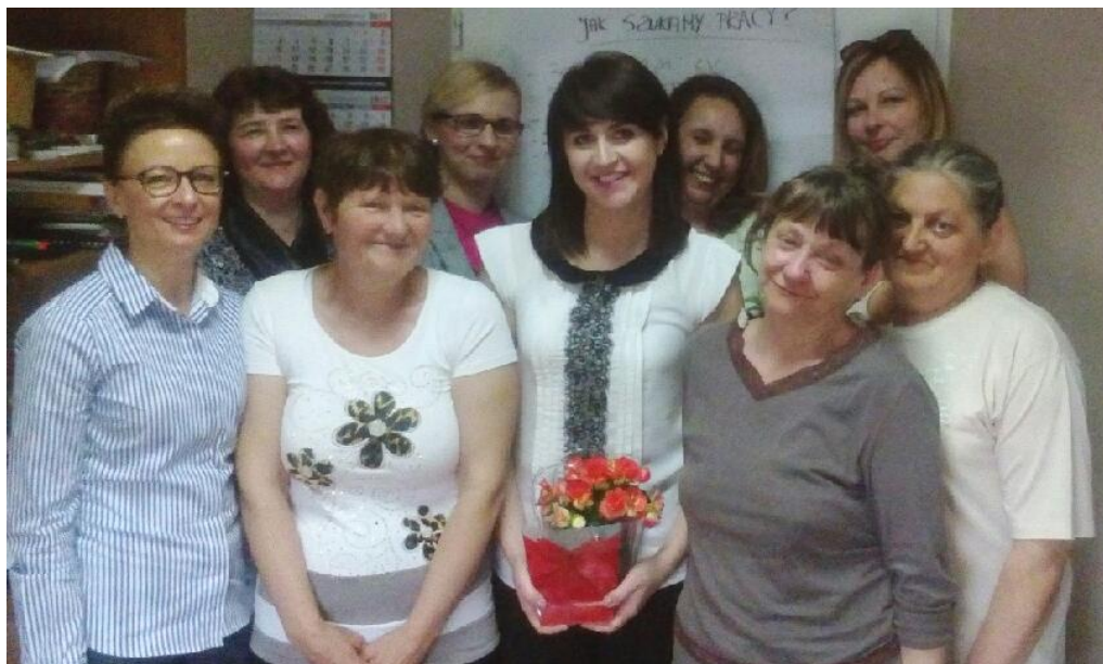
Uczestniczki szkolenia w Punkcie PUP w Twardogórze

W dniu 26 maja 2017r. w Powiatowym Urzędzie Pracy w Punkcie w Twardogórze oraz Filii w Sycowie zakończyły się szkolenia z zakresu umiejętności poszukiwania pracy pt: „Szukam Pracy”. Szkolenia realizowane były przez trzy tygodnie w okresie od dnia 08.05.2017r. do dnia 26.05.2017r. Celem szkoleń było teoretyczne i praktyczne przygotowanie osób bezrobotnych do poruszania się po rynku pracy. Szkolenie przeznaczone jest w szczególności dla osób długotrwale zarejestrowanych w Powiatowym Urzędzie Pracy, które w związku z powtarzającym się niepowodzeniem w podejmowaniu pracy utraciły motywację do jej poszukiwania. Podczas szkolenia uczestnicy mogli m. in.: poznać procesy i tendencje zachodzące na rynku pracy, które mają bezpośredni wpływ na sposób i skuteczność poszukiwania pracy, poznać swoje mocne i słabe strony, dokonać bilansu umiejętności, przygotować się do autoprezentacji, poznać zasady pisania dokumentów, przygotować się do spotkania z pracodawcą oraz opracować strategie pokonywania barier w zatrudnieniu. Natomiast w części praktycznej uczestnicy nawiązywali bezpośrednie kontakty z pracodawcami, składali dokumenty aplikacyjne w zakładach pracy oraz umawiali się na rozmowy kwalifikacyjne.