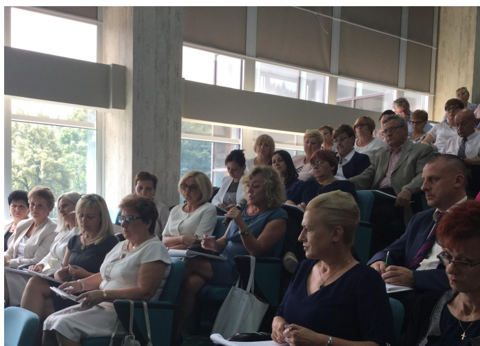
Uczestnicy Konwentu Dyrektorów Powiatowych Urzędów Pracy 7 Województw