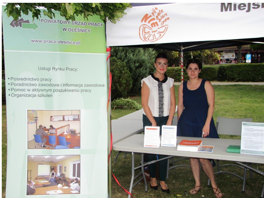
Stoisko doradców zawodowych PUP

niezarejestrowane w PUP. Zainteresowani mogli też zapoznać się z ofertami pracy w różnych zawodach z terenu powiatu oleśnickiego adresowanymi do osób z niepełnosprawnościami. Doradcy zawodowi informowali także pracodawców o możliwości uzyskania wsparcia ze środków Funduszu Pracy i PFRON przy zatrudnianiu osób z niepełnosprawnościami.