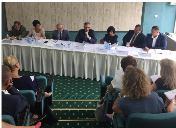
Sekretarz Stanu MRPiPS Stanisław Szwed na Konwencie Dyrektorów Powiatowych Urzędów Pracy 7 Województw

Uczestnicy wskazywali na rzeczywiste problemy napotymane przy realizacji zadań wyznaczonych w ustawie. Zgłoszone uwagi oraz wymiana spostrzeżeń na etapie tworzenia projektu ustawy, miały pomóc w nadaniu planowanym zmianom praktycznego wymiaru oraz przygotowaniu urzędów pracy do nowych zadań.