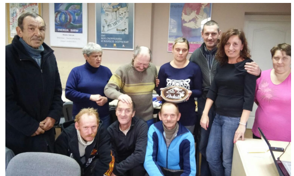
Uczestnicy Programu Aktywizacja i Integracja: po lewej grupa w Sycowie, po prawej grupa w Oleśnicy.