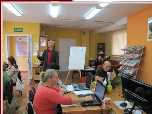
Uczestnicy projektu podczas szkolenia w Twardogórze - II grupa.

Powiatowy Urząd Pracy w Oleśnicy od marca 2014 r. realizuje projekt „ECDL - Dobry Start”, który współfinansowany jest ze środków Unii Europejskiej – Europejskiego Funduszu Społecznego w ramach Programu Operacyjnego Kapitał Ludzki, Poddziałanie 9.6.2. Podwyższanie kompetencji osób dorosłych w zakresie ICT i znajomości języków obcych.