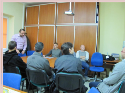
Rozmowy kwalifikacyjne z przedstawicielem pracodawcy z Wielkiej Brytanii.