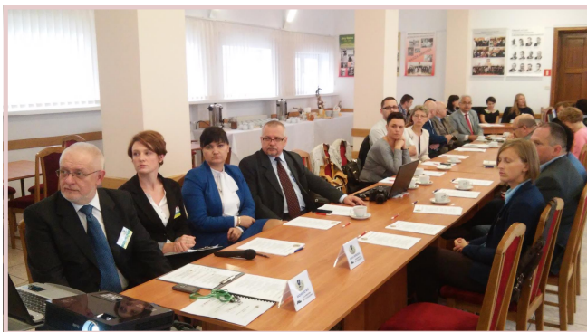
Warsztaty w Kępnie