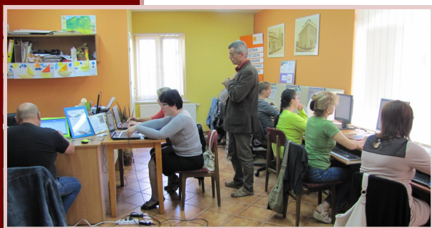
Szkolenie komputerowe ECDL w Twardogórze.

Udział w projekcie jest bezpłatny. Uczestnicy projektu otrzymają materiały dydaktyczne, sfinansowane również są koszty egzaminu przeprowadzonego przez certyfikowanego egzaminatora ECDL.