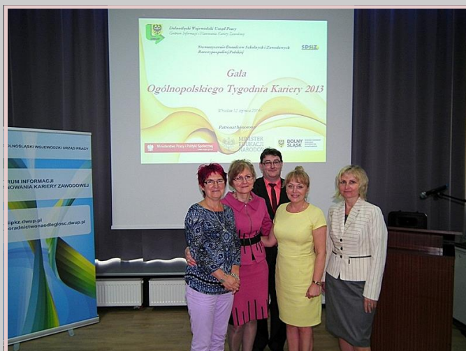
Gala OTK we Wrocławiu.

opracowała: Katarzyna Sowa - Specjalista ds. programów