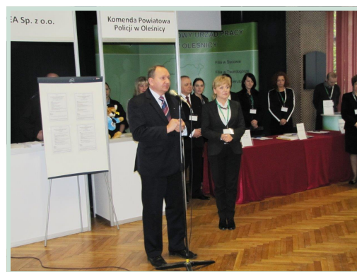
Uroczyste otwarcie V Targów Pracy

Wszystkim pracodawcom, mieszkańcom powiatu oleśnickiego oraz zaproszonym gościom, którzy uczestniczyli w naszym przedsięwzięciu, a także Zespołowi Szkół Ponadgimnazjalnych im. Marii Skłodowskiej-Curie za udzielone wsparcie przy organizacji targów, Dyrekcja oraz pracownicy Powiatowego Urzędu Pracy w Oleśnicy serdecznie dziękują i zapraszają na kolejne targi pracy, które organizowane będą w przyszłości.