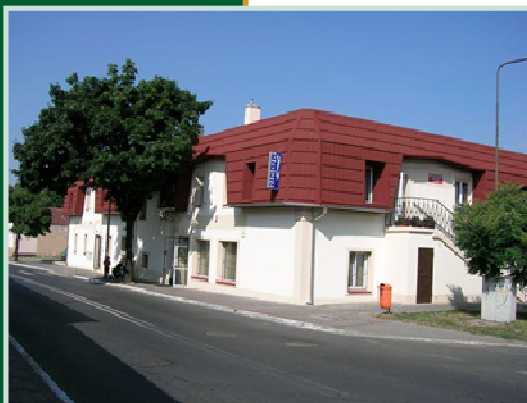
Siedziba Filii PUP w Twardogórze oraz Biblioteki Publicznej MiG w Twardogórze.

W ramach dobrych praktyk Powiatowy Urząd Pracy Filia w Twardogórze współpracuje z Biblioteką Publiczną Miasta i Gminy w Twardogórze. W Bibliotece cyklicznie odbywają się grupowe zajęcia z bezrobotnymi, które prowadzi Lider Klubu Pracy oraz Doradca Zawodowy. Lider Klubu Pracy przeprowadził w tym roku 9 takich zajęć, w których udział wzięło 98 osób. Tematy zajęć to "Jak i gdzie szukać pracy", "Jak przygotować się na spotkanie z pracodawcą - rozmowa kwalifikacyjna" i "Jak sporządzać dokumenty aplikacyjne". Doradca Zawodowy przeprowadził w Bibliotece 3 zajęcia, w których udział wzięło 26 osób. Temat zajęć to "Podstawowe usługi rynku pracy".